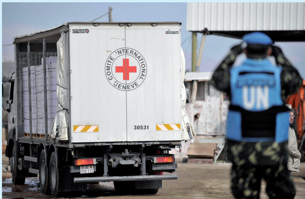
The Red Cross working in Jerusalem.

The ICRC acts on disasters, health emergencies, and war conflicts to meet the needs and to improve the lives of vulnerable people.