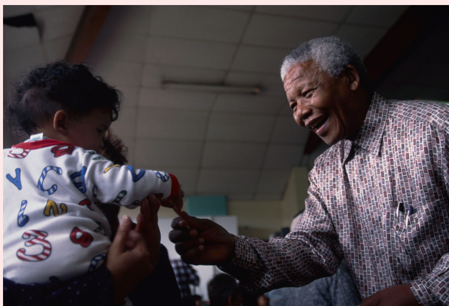
Nelson Mandela combateu a segregação racial na África do Sul.

Quando alguém deseja enriquecer, a pergunta que a pessoa deve se fazer é: Trabalharei e, se enriquecer, irei fazê-lo com a intenção de contribuir para que a minha comunidade possa melhorar?